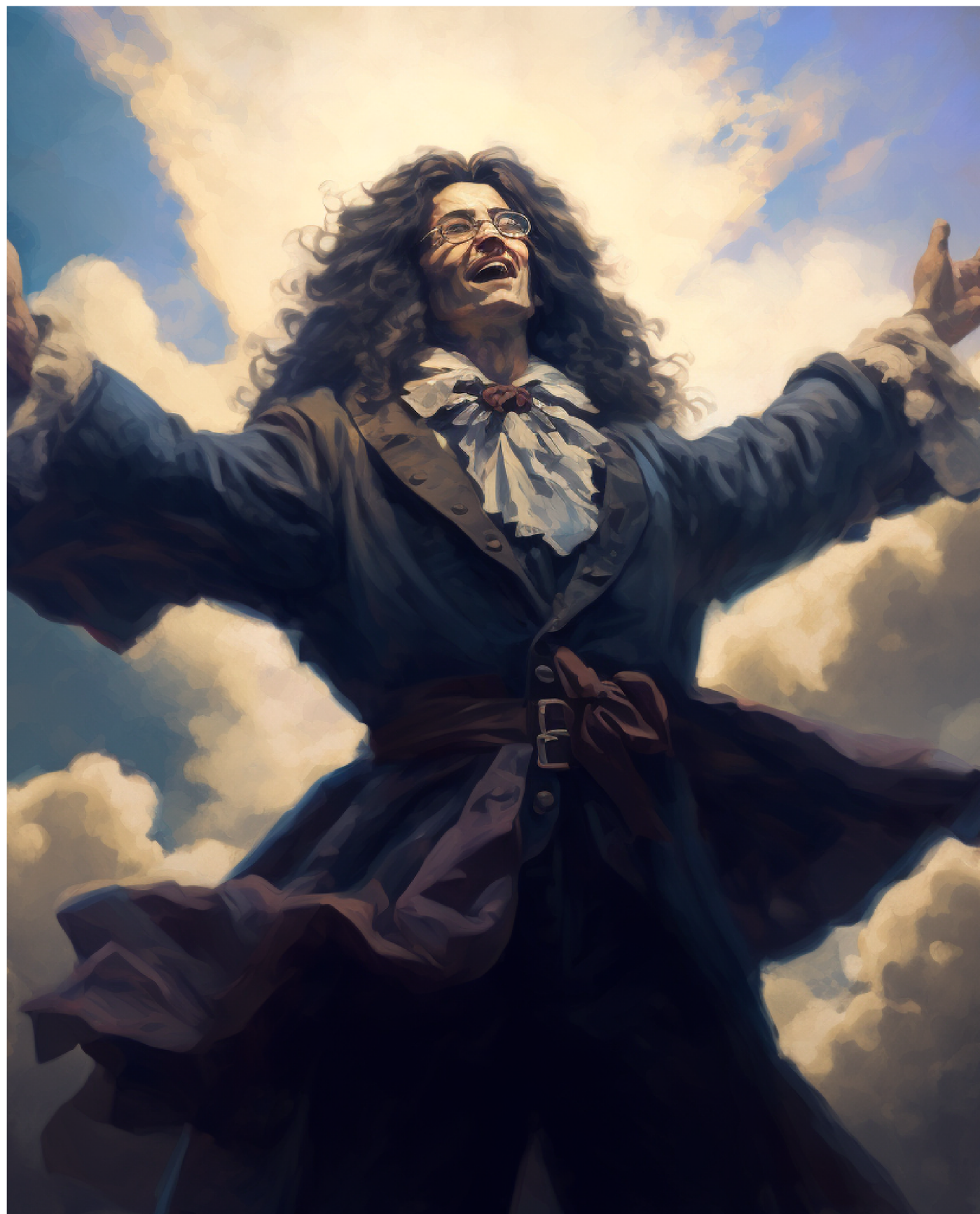
Готфрид Вильгельм Лейбниц (1646-1716)